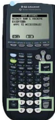
TI 82 Advanced