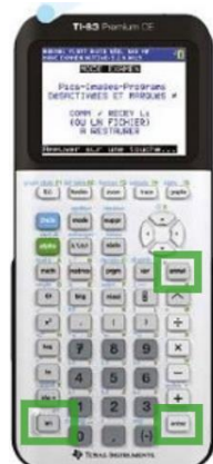
TI 83 CE